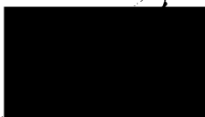
Mgr. Jiří Koubek starosta městské části Praha-Libuš (za poskytovatele dotace)