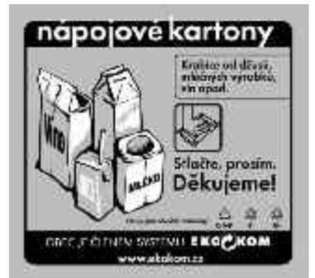
Nálepka na nádobě určené pro sběr nápojových kartonů

prázdné, vypláchnuté a stlačené. Zprvu budou k dispozici poměrně malé nádoby, které budou svázeny jednou za čtrnáct dní, je v zájmu každého z nás, aby byla zachována čistota v okolí stanoviště sběru.