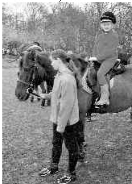
Takto nám to sluší na koni

Děti si koně prohlédly a členky oddílu je i poučily a názorně ukázaly, jakou péči tato krásná zvířata vyžadují. Nejvíce měli všichni radost z možnosti projet se na závěr na koni a z nečekaného dárku podkovy pro štěstí. Pohodu nám zkazil jen déšť a zima. O to více