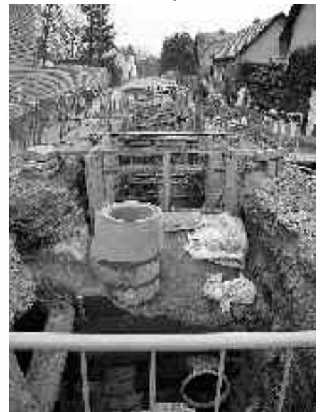
V Písnici pokračuje budování kanalizace

–Zaznamenala Hana Kolářová–