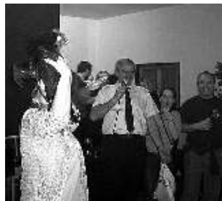
Tak tohle je hlavní cena, ...budík!