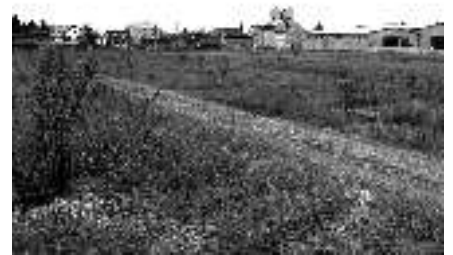
V tomto prostoru za písnickým fotbalovým hřištěm by měly vyrůst výškové domy. Stavební záměry kriticky sledují lidé z nového občanského sdružení Rodinné domy.