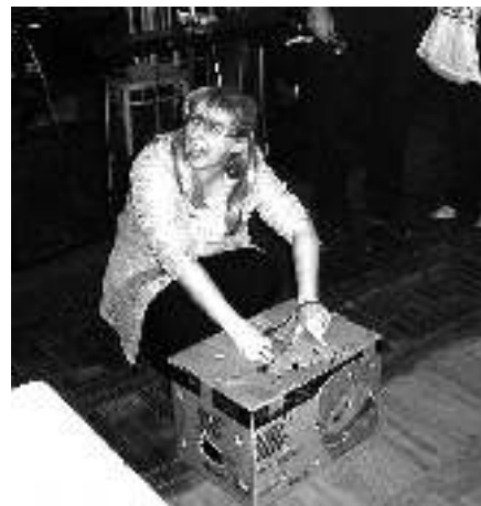
Hlavní cenou tomboly je...