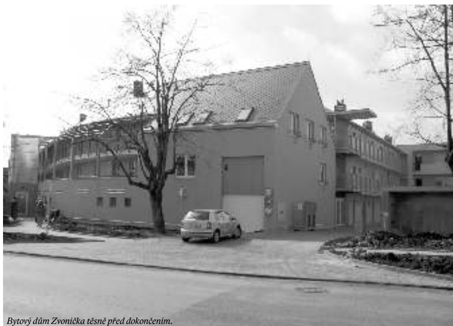
Bytový dům Zvoníčka těsně před dokončením.

–Zaznamenala Hana Kolářová–