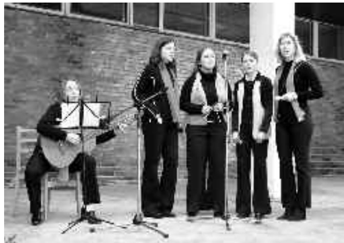
Sbor dívek z Klubu Junior zahajuje dojemným zpěvem státní hymny včetně její další, podstatně méně známé sloky.

Tento den byl uspořádán za velké finanční a věcné podpory sponzorů z řad místních firem. Chtěla bych jim za to velice poděkovat a na další straně uvést jejich názvy: