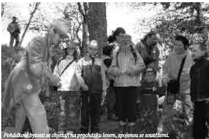
Pohádkové bytosti se chystají na procházku lesem, spojenou se soutěží.