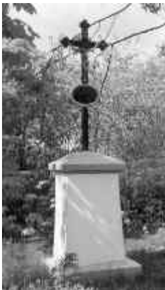
Boží kříž na rozcestí do Cholupic