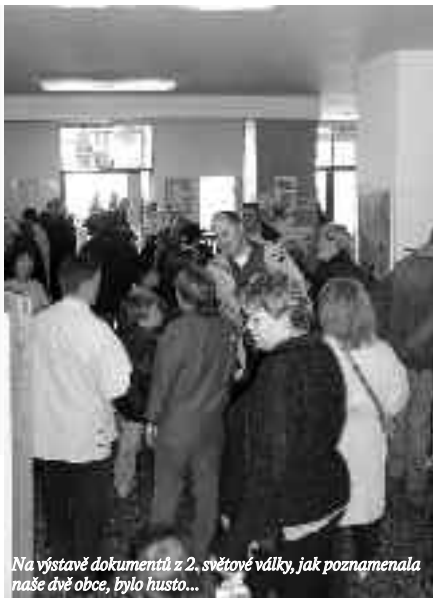
Na výstavě dokumentů z 2. světové války, jak poznamenala naše dvě obce, bylo husto...