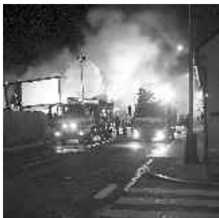
Ulice Meteorologická 7. května nad ránem.