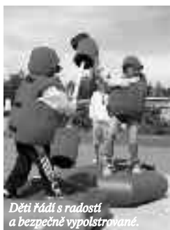
Děti řádí s radostí a bezpečně vypostrávané.

DKV ELEKTRO CENTRUM, s.r.o., KRATOCHVÍL střechy, s.r.o., OPTIKA TEREZA, JANPET pneuservis, SETRON, s.r.o., AUTOPRAVNA brá BUBNOVÉ, TINTĚRA EUROCAR, ZEDNÍK LIBOR, AUTO - SVOBODA, VETNEMO, s.r.o., PROJEKCE MASNÝCH ZÁVODŮ, s.r.o., PRO TRADE, s.r.o., DKNV, s.r.o., AUTODOPRAVA - HADOS, SKLADY ŠIPAN, UNIKLEMP, EVROPOS, MAXDORF, KOKR sdružení, MIRAX, XAVEROV, a.s., PEMAR, s.r.o., 2PM autoopravna, BEAM ČR, s.r.o., MARKO hračky, HERAN sdružení, VPO PLAST, s.r.o., KONTAKT-servis, DDD SERVIS, s.r.o., BOHEMIATEL, s.r.o., NEOSET, CROATIA TRADE PRAHA, s.r.o., Jan NAIDR, s.r.o., DATZER, s.r.o., FONTANA WATERCOOLERS, s.r.o., AAC CZECH, s.r.o., ESSELTE, s.r.o., PETR ZACH truhlářství, SAPARIA, a.s., TTTM SAPA, s.r.o., H & D FASHION, FACO, s.r.o., AT COMP, s.r.o., DALIMEX, s.r.o., VTS HOLDING, s.r.o., NTT Group, s.r.o., INTERMARKET, s.r.o., CLUB 777, LALANDE, s.r.o., HOME comfort, s.r.o., JANETTE, s.r.o.