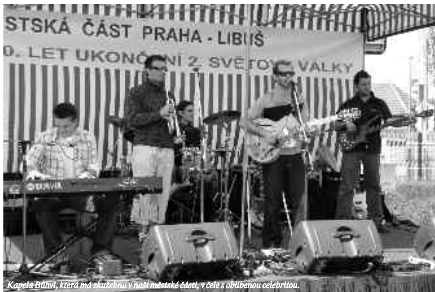
Kapela Bůhvi, která má zkušebnu v naší městské části, v čele s oblíbenou celebritou.