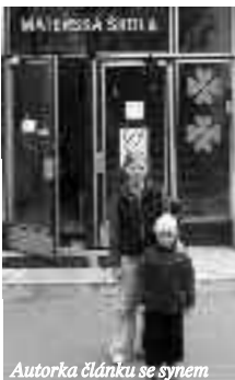
Autorka článku se synem