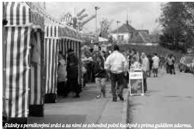
Stánky s perníkovými srdci a za nimi se schovává polní kuchyně s prima gulášem zdarma.