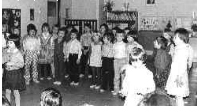
MŠ Lojovická před 25 lety