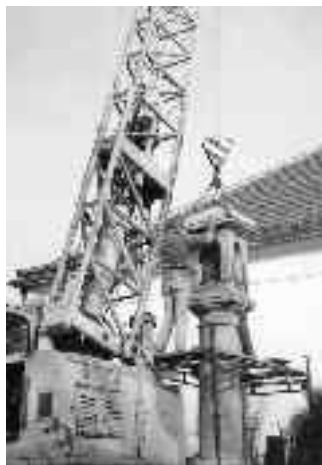
Zvonička u libušské pošty, při nasazování stříšky za pomoci jeřábu (nahore), zvonička před rekonstrukcí (vlevo), s novým zvonkem (vpravo).