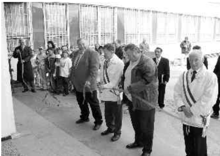
Starostové Prahy-Libuše, francouzského Caudebecu a polabských Zálezlic právě přestřihli pásku před vstupem na výstavu.

Větší děti se již těšily na sportovní klání ve vybíjené mezi ZŠ L. Coňka a ZŠ Meteorolo-