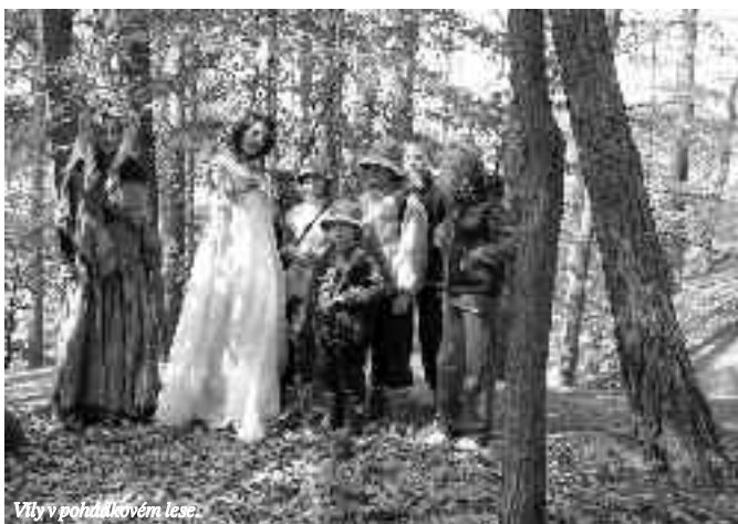
Vlky v pohádkovém lese.