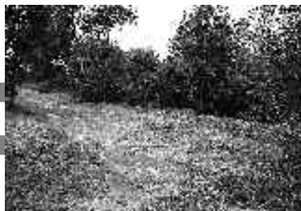
V Hrobech před úklidem a po úklidu