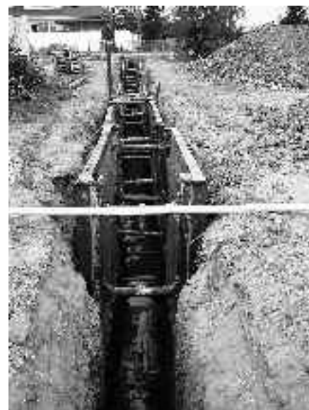
Rozsah a provedení podélné geologické sondy ukazují fotografie.

Státní stavební dozor uvedl, že je vše v pořádku. Podle našeho názoru (možná naivně mylného) by dozor měl na základě odborných znalostí nejen zkontrolovat technickou správnost dle projektu, povolení, vyjádření, ale také umět posoudit, zda stavba není určena pro něco jiného, než je deklarováno.