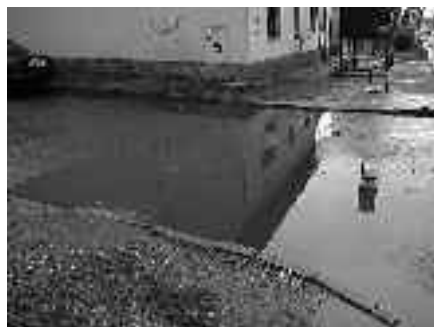
Ulice Na Močále před opravou a po ní

Během léta proběhly opravy komunikací Paběnická a K Jezírku. Prašné komunikace jsou průběžně provizorně vyspravovány štěrkem nebo recyklovanou frézovanou živící,