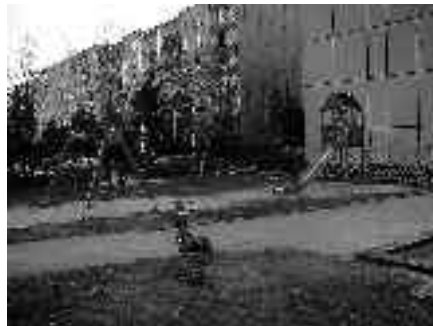
Nově zrekonstruované hřiště v ulici K Lukám