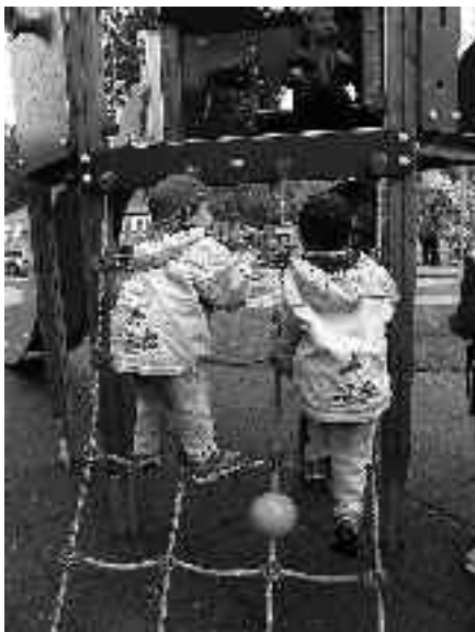
Ukázka některých z prvků, které budou osazeny na dětském hřišti v ulici Hoštické, byla nafocena při otevření dětského hřiště v Lysolajích.