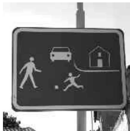
Dopravní značka IP 26a – Obytná zóna, foto Martin Klemes.