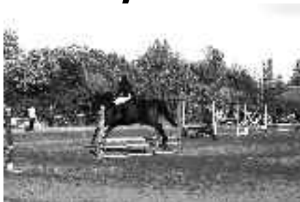
Z loňských závodů JO TJ TEMPO Praha

busy MHD 113, 331 a 333, zastávka Ke Březině. Parkování a občerstvení zajištěno. Podrobnější informace o Jezdeckém oddíle TJ TEMPO Praha jsou k dispozici na našich stránkách www.volny.cz/tjtempo .