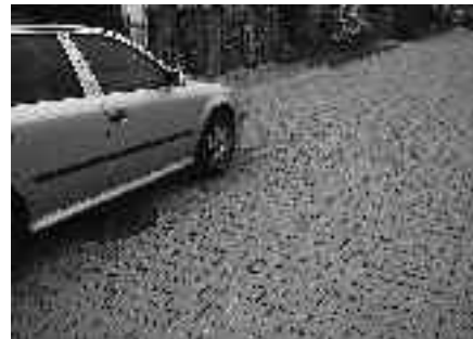
Parkovací místo vyznačené v zámkové dlažbě