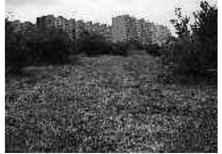
V Hrobech po posečení

Obtížné zůstává udržování pořádku na těchto pozemcích, které si někteří lidé zřejmě pletou se smetištěm a odhazují sem odpadky jako papír, obaly a plastové lahve, ale i pneumatiky, televizory a dokonce lednice a mrazáky. Úklid je pak finančně náročný a bohužel pouze dočasný, protože za několik dní se zde odpad zpravidla objeví znovu.