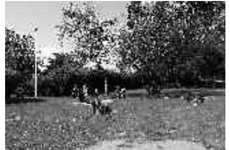
Stávající stav dětských hřišť v ulici Hoštická a u rybníka Obecník. Na rekonstrukci těchto hřišť se můžete těšit ještě v letošním roce.