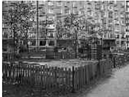
Oplocené hřiště na sídlišti Písnice

Letos bychom chtěli kompletně realizovat dětská hřiště v ulici Hoštická a u rybníka Obecník. Oslovili jsme a vyhodnotili čtyři autorizované výrobce, kteří splňovali obsah norem nutných pro provozování dětského hřiště. Při výběru dodavatele jsme se snažili vyhovět co nejširšímu okruhu našich malých spoluobčanů. Věříme, že po