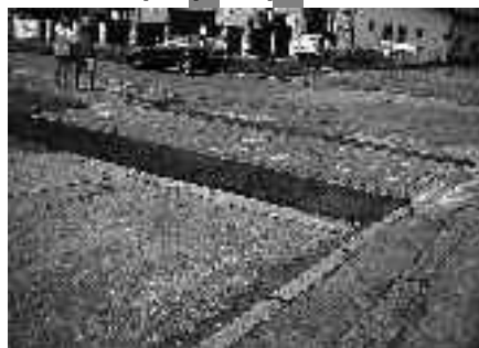
V Hrobech před úklidem a po úklidu

– Jana Drobílková, OŽPD ÚMČ Praha-Libuš, Foto autorka–