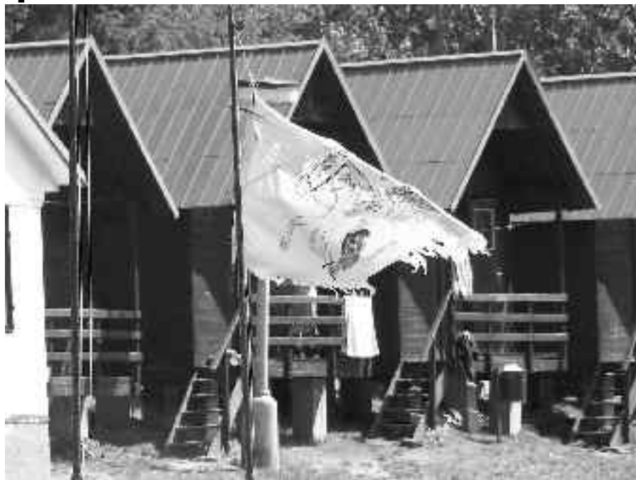
Letní dětský tábor v Čisté u Rakovníka