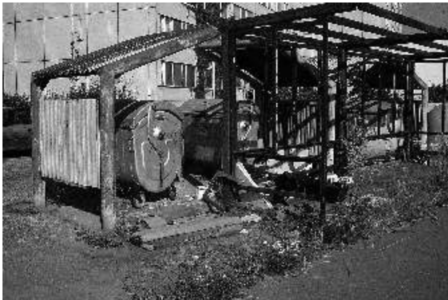
Stanoviště kontejnerů v ulici Mílová. Vlastníci objektů jsou družstva Libuš-Domovina a Libuš 687 a 688.

–Jana Drobílková, odbor životního prostředí a dopravy ÚMČ Praha-Libuš–