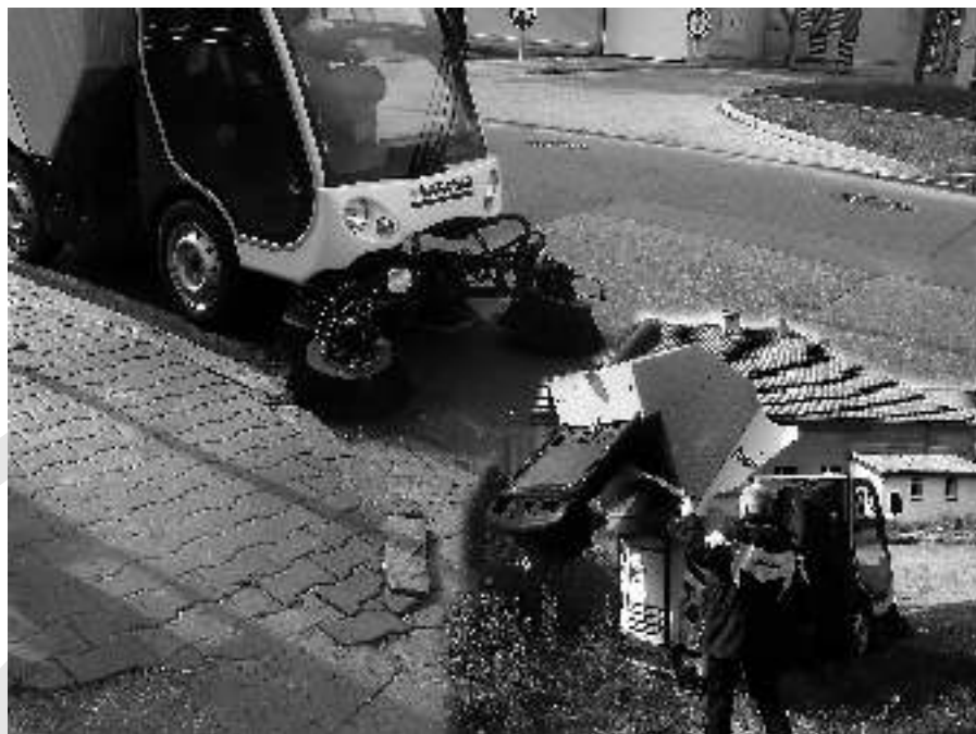
Předvádění stroje na čištění ulic a chodníků