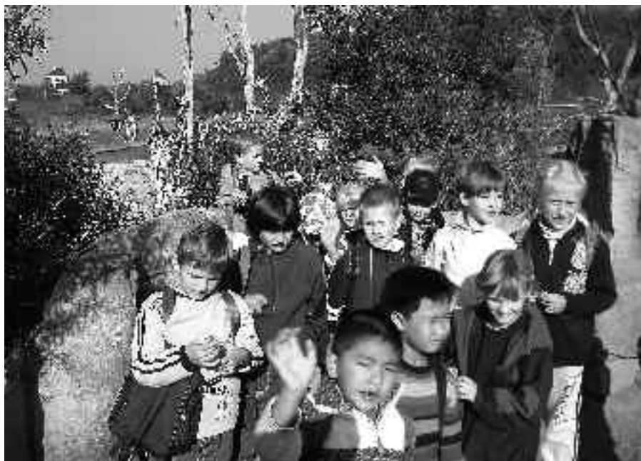
Tak trochu v Africe...