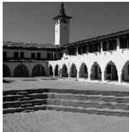
Univerzita v kyperské Nikosii

Stejně jako naši kluci i ti kyperští milují fotbal a s nadšením ho hrají o přestávkách.