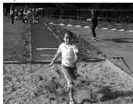
Vzpomínka na konec minulého školního roku v ZŠ Meteorologická: Sportovní klání v lehké atletice a ve vybíjené. Sláva vítězům a čest poraženým! A úspěšný nový školní rok všem!