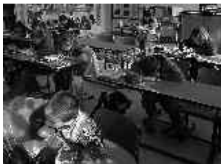
Ze ZŠ Meteorologická