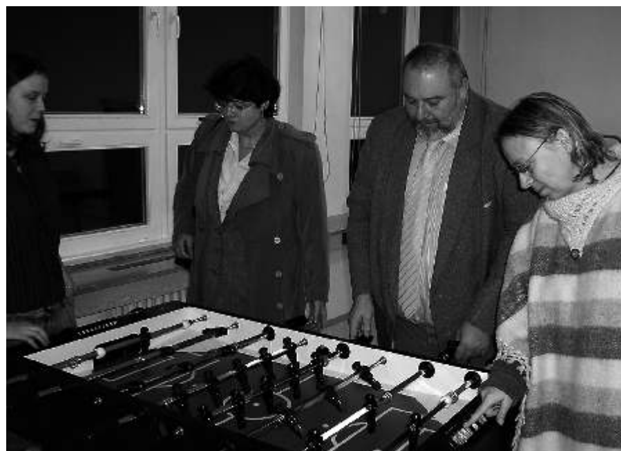
První okusili fotbálek v Teen klubu...

Tak se snažte. A co si zatím aspoň vylepšit ten klub současný? Vyhlašuji tímto soutěž o nejlepší návrh výzdoby (obraz či dokonce celého prostoru) klubu. Své návrhy noste do klubu do 9. 12. Všechny díla budou vystavena (nezapomeňte uvést své jméno a věk, případně kontakt na sebe) a z nich vyberete ten nejlepší. Autor dostane cenu (puzzle nebo diablo – co si vybere) a jeho návrh se na naše náklady zrealizuje! Jen předem upozorňuji, že nejsme tak bohatí, tak si odpusťte výzdobu z drahokamů a zlata. Moc se na vaše návrhy těším a samozřejmě jméno vítěze uvedeme i v tomto časopise! (Více na www.teen-libus.estranky.cz .)