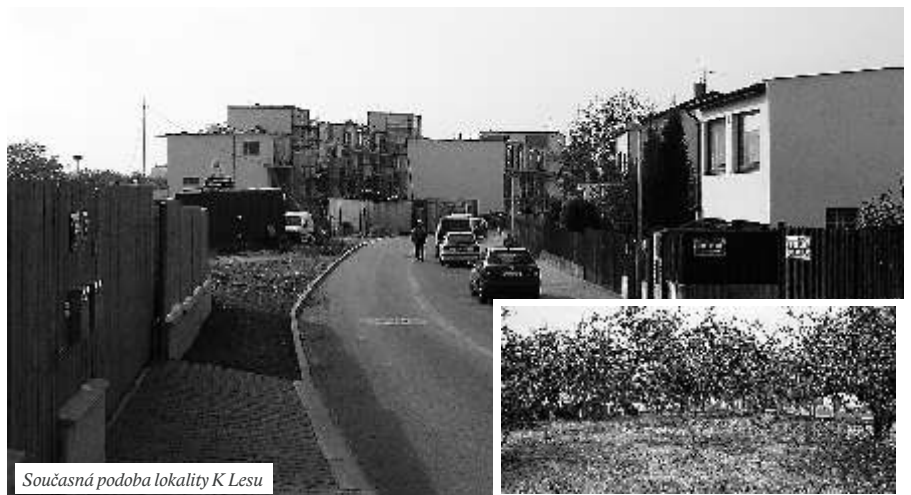
Současná podoba lokality K Lesu

–Pavel Macháček (mistostarosta@praha-libus.cz)–