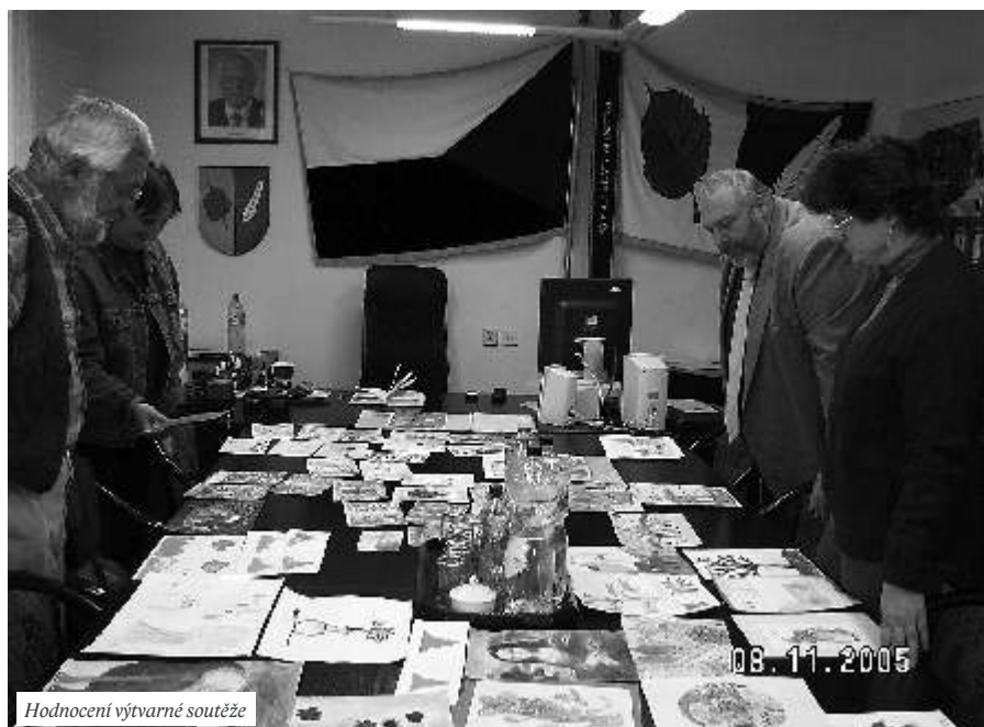
Hodnocení výtvarné soutěže

Čtvrtek 3. listopad. Česká televize, pořad Černé ovce. „Současně mě navštívili zástupci sdružení Rodinné domy p. Bagin a p. Hrášek. Redaktoři se dotazovali na změnu územního