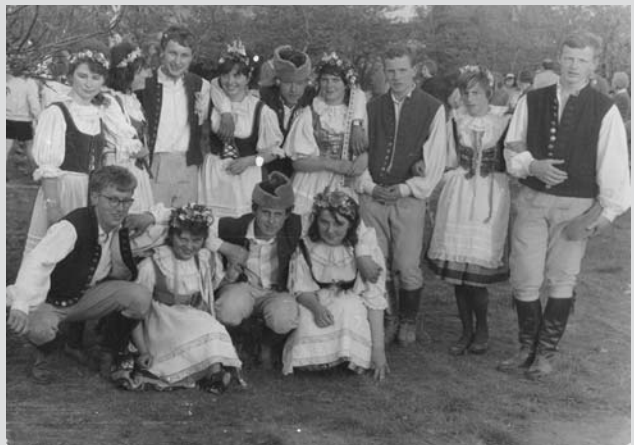
Středočeské máje v roce 1964 v Písnici.