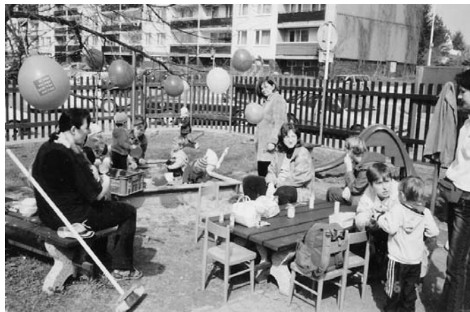
↑ 20. dubna jsme si užili Den Země.

14. 6. – středa ■■■ Narozeni-nová oslava – s dětmi, které se narodily v květnu, oslavíme jejich narozeniny. Zaspíváme jim, zatančíme si, pro malé oslavence máme i drobné dárečky a pro všechny malé občerstvení. Neváhejte a přihlaste své oslavence na telefonu 603 591 667 do 11. 6. 2006 kvůli domluvě na občerstvení. Ostatní mohou přijít bez předchozího ohlá-