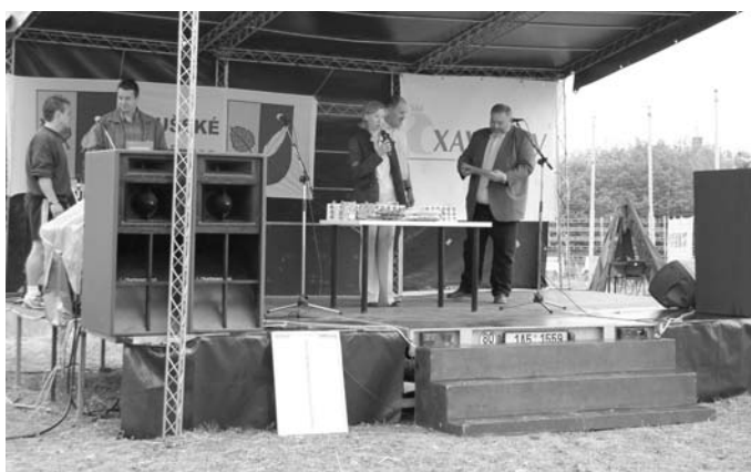
↑ Chystá se předávání cen vítězům soutěže místních mladých hudebníků Libhush.