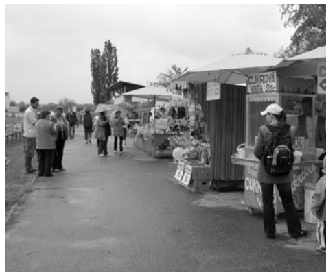
↑ Ulička štěstí, cukrové vaty a perníkových srdcí.