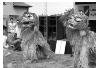
↑ Asijské bojové umění zvládne třeba dva draky naráz.