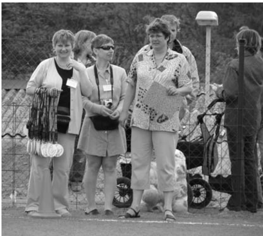
↑ Vítěz na dohled.