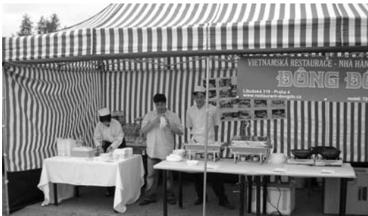
↑ Něco exotického kulinářství.