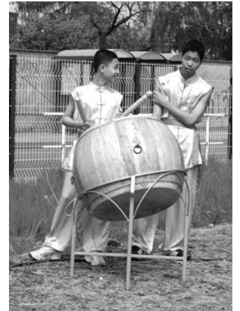
↑ Efektní úbor, efektní rytmus.