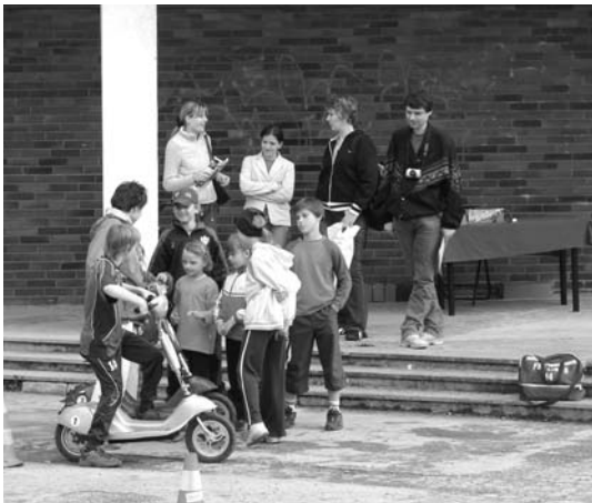
↑ Na elektroskútrech vjezd k libušské škole povolen.