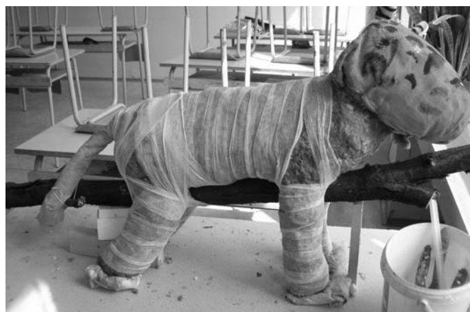
↑ Sušení novin.