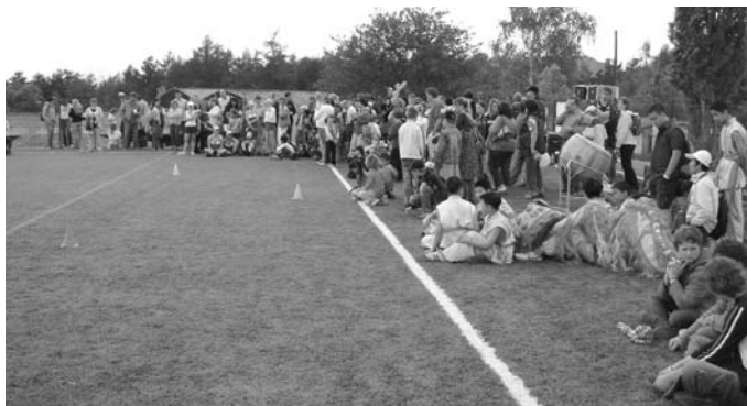
↑ Čekání na Libušské kuřátko.