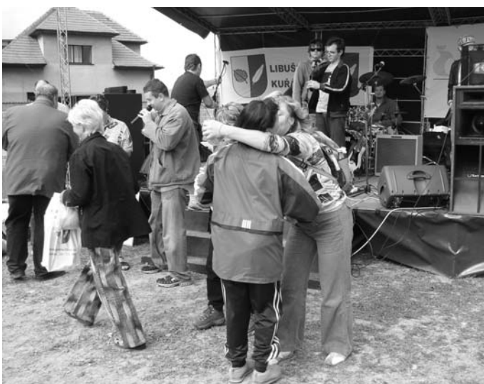
↑ Zatímco skupina Buhví ladila...