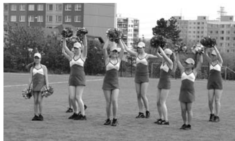
↑ Roztleskávačky. Prostě pěkné.