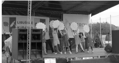
↑ Spousta vystoupení našich milých.