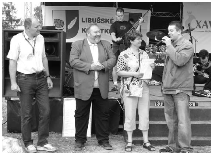
↑ Kulturně-společenský den aneb Libušské kuřátko 13. května 2006

Sobota 13. květen. V naší městské části proběhl kulturně-společenský den na fotbalovém hřišti FSC Libuš. Musím poděkovat nejen organizátorům, což jsou především pracovníci humanitního odboru Úřadu MČ Praha-Libuš, ale i všem vystupujícím a návštěvníkům za to, že vytvořili pěknou atmosféru i přes nepřízeň počasí, která nás několikrát během tohoto dne potrápila. Rád bych také touto cestou poděkoval FSC Libuš za poskytnuté prostory. Myslím, že tento svátek by se měl stát tradicí naší obce. Lidé, kteří se delší dobu nevidí, mají možnost na takovéto akci se setkat. Takové setkávání lidí zde bylo dle mého názoru dlouho-