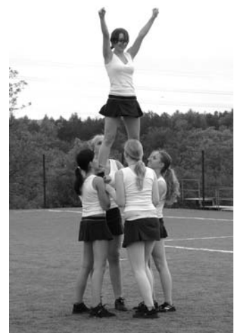
↑ Podívaná všeliká.