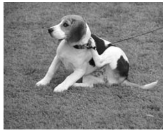
↑ Některé rodiny se ukázaly kompletní.