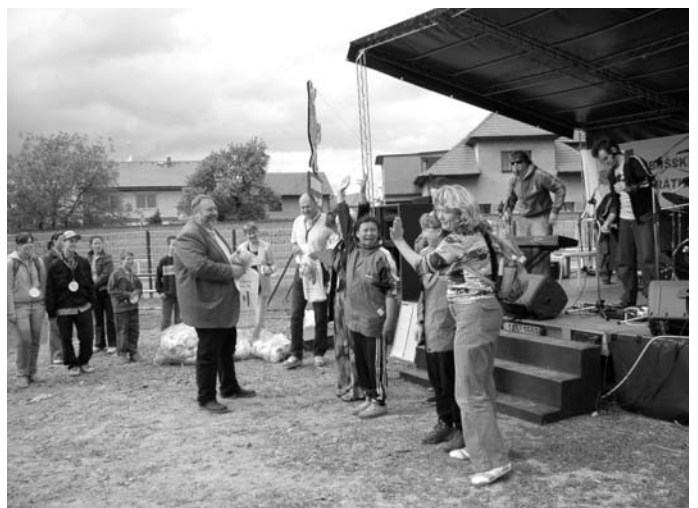
↑ Předávání Libušských kuřátek vítězům soutěže

době zanedbáváno. Myslím, že to prospěje a potěší.