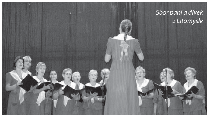
Sbor paní a dívek z Litomyšle