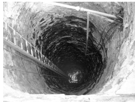
↑ Současná studna u domu čp. 1. Hloubka 11,5 m. ➔ Nový hrad asi v roce 1850 dle kresby Edvarda Herolda. Zeď na kopci je ve skutečnosti pozůstatek hájovny.

◀ Šipka ukazuje místo, kde se navážka začíná propadat.