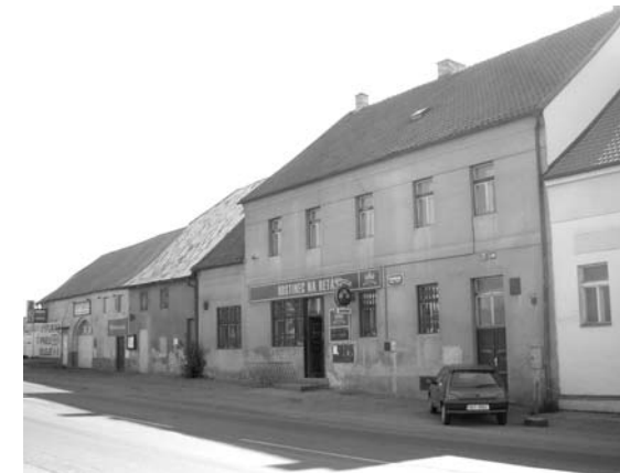
➔ Starobylá hospoda Na Betáni z Vídeňské ulice.