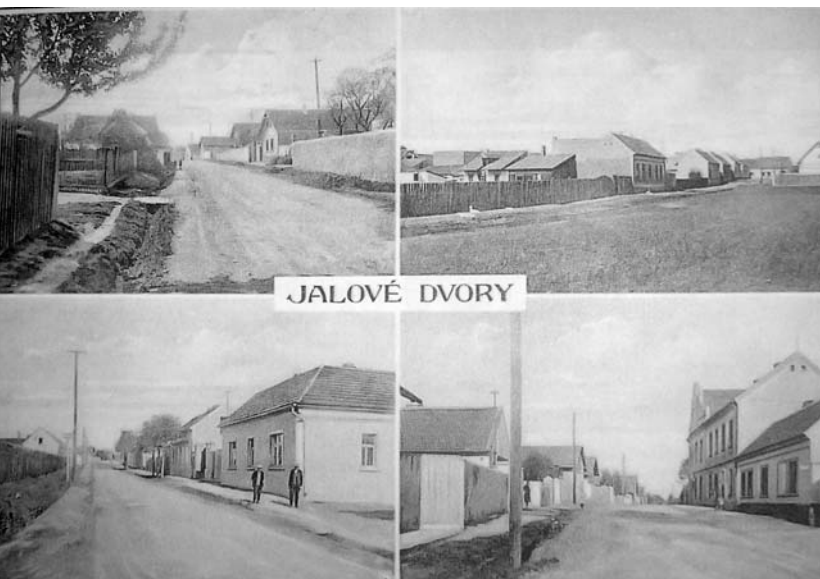
◀ Jalové Dvory – Stará pohlednice

Tato stará cesta dnes nese jméno Vídeňská. A hospoda, která při ní leží jen několik kilometrů od někdejších pražské brány, má dost možná stejně dávnou historii. Podle pověsti, kterou již v roce 1912 Cyril Merhout nazývá jako starobylou, se za vlády Václava IV. jmenovala U zeleného ptáka. I král sem prý chodíval posedět, aby vyzvěděl, co se povídá v neklidných dobách v předve-