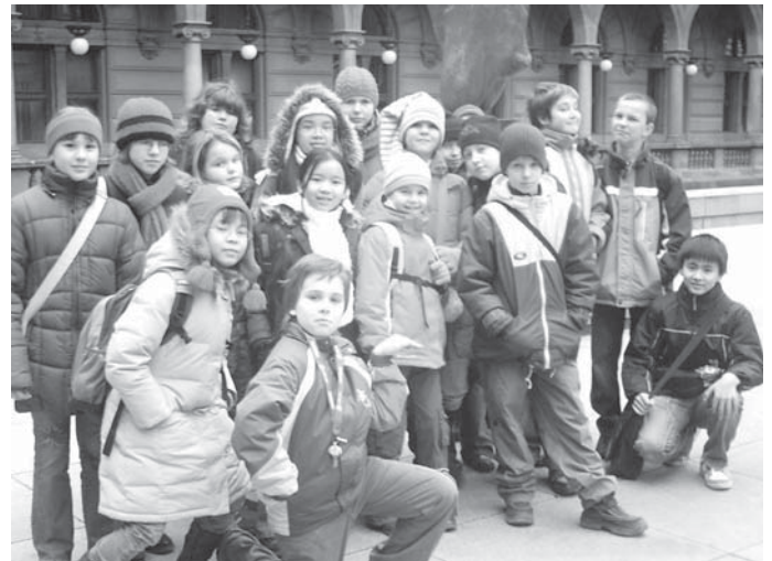
↑ 5. A na výletě do Národního divadla → Komba ušatá

25.1. jsme navštívili sdružení Tereza v Haštalské ulici a zúčastnili jsme se pořadu S užovkou v umyvadle. Nejdříve jsme se rozdělili do dvou skupin po devíti dětech. Když jsme byli všichni ve svých třídách, představovali jsme se. Také jsme kreslili, jak si představujeme, že se voda dostane z přehrady do kohoutku. Pak jsme se rozhodli ukázat si cestu vody doopravdy a stavěli jsme model. Dostali jsme na něj papírové potrubí, úpravnu vody a přídatnu chlór. Vzhledem k tomu, že jsme neměli domácnost moc daleko, bylo to poměrně lehké. Pak jsme hráli pantomimu, která bavila skoro všechny. Já si vylosovala zalévání květin a čištění zubů. A potom jsme už vodu čistili. Nejdřív jsme procházeli se zavázanými očima potrubím. Když jsme