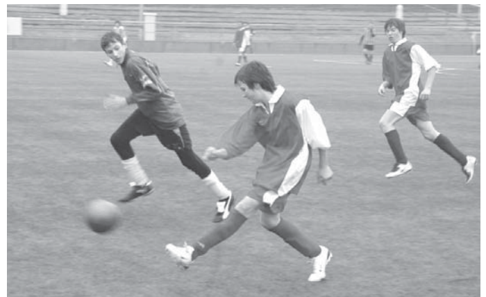
↑ Coca Cola Cup 08

I ve školní družině navazujeme na školní vzdělávací program a společně putujeme při hrách po