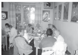
Posezení v místní restauraci U Holečků.