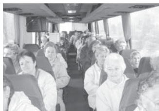
V autobusu k letohrádku Hvězda.