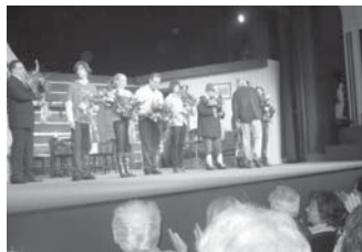
Návštěva oblíbeného Branického divadla 29. 4. 2008 To byl teda silvestr!!!