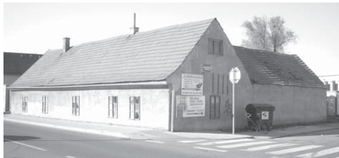
↑ Dům čp. 25 na Libušské ulici v místě, kde se dodnes říká Na Rybníčku je zřejmě jednou z mála libušských staveb, která od svého vzniku nebyla výrazněji přestavěna.

Ukažme si způsob datování na příkladu domu čp. 25. Je zvláštní tím, že za celou dobu své existence zřejmě nebyl výrazněji přestavěn. Využijeme serveru www.mapy.cz . Zadáním hesla Libuš 25 nám počítač zobrazí dům ze zdejší fotografie a pomocí tabulky se můžeme pokusit určit, kdy byl při-