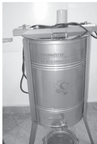
↑ Moderní přístroj k vytáčení medu z plástů.