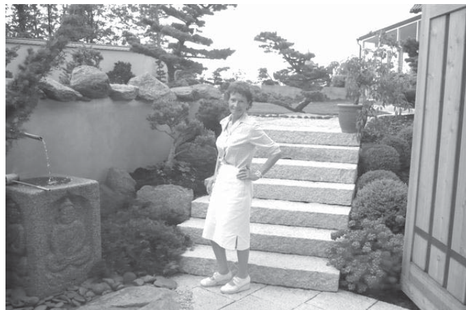
↑ Návštěva japonské zahrádky