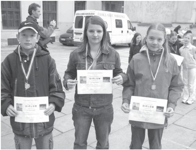
↑ Přebor sokolské všestrannosti