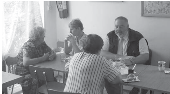
↑ Na setkání v Klubu Senior.