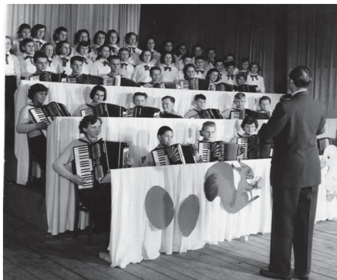
↑ Snímek z dob, kdy akordeonový orchestr ještě doprovázel pěvecký sbor.