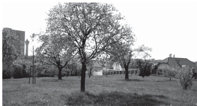
Park U zahrádkářské kolonie v současném stavu.

PaedDr. Jaroslava Adámková, zástupce starosty