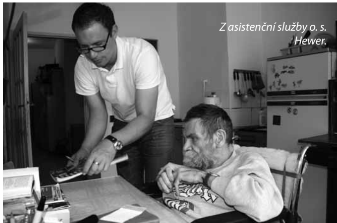
Z asistenční služby o. s. Hewer.

Osobní asistence nebo pečovatelská služba? Klidně obojí.