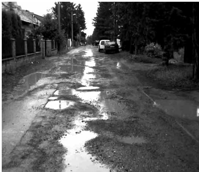
Ulice Ke Kašně před opravou...

Zuzana Kuryviálová, odbor životního prostředí a dopravy ÚMČ Praha-Libuš