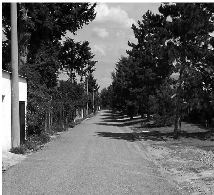
...a po opravě