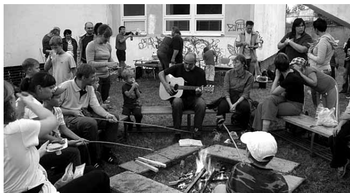
↑ Rodiče mohli poslední zářijový pátek využít pozvání k posezení u ohně na zahradě Základní školy Meteorologická. Atmosféra byla velmi příjemná.

→ Pořádáme školní akce pro rodiče v termínech a hodinách, které jim umožní se jich opravdu zúčastnit.