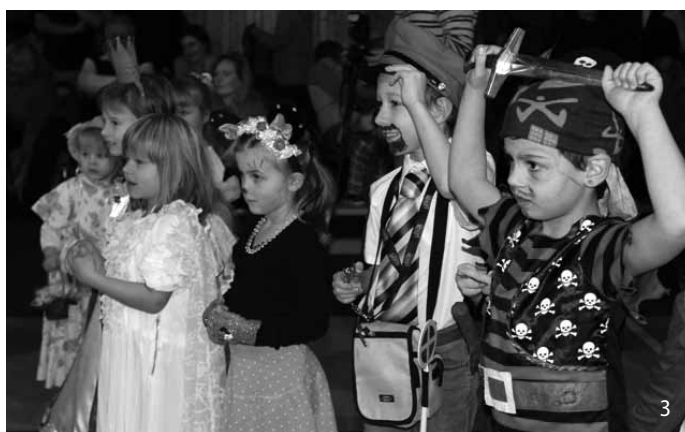
1| Piráti si domlouvali taktiku na společný útok na taneční parket.