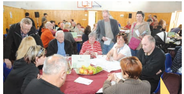
U jednotlivých tematických stolů se pak diskutovalo a sepisovaly se aktuální problémy, které libušští a písničtí obyvatelé vnímají v následujících šesti oblastech.

Rozvoj městské části, bezpečnost, veřejná správa.