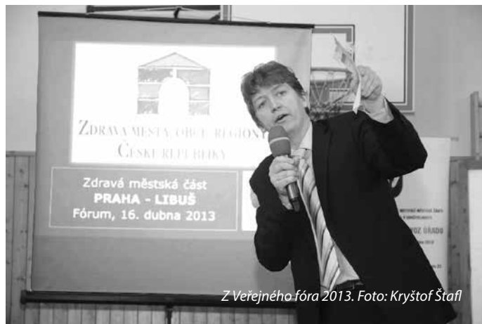
Z Veřejného fóra 2013.