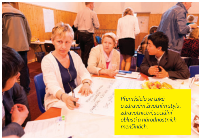
Přemýšlelo se také o zdravém životním stylu, zdravotnictví, sociální oblasti a národnostních menšinách.