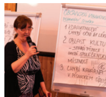
Po „volbách“ problémů u tematických stolů jejich zástupci představili ostatním, na čem se shodli jako na nejdůležitějším k řešení – zde za občanskou vybavenost, podnikání a služby.