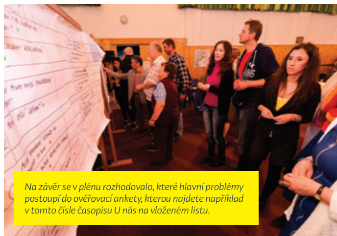
Na závěr se v plénu rozhodovalo, které hlavní problémy postoupí do ověřovací ankety, kterou najdete například v tomto čísle časopisu U nás na vloženém listu.