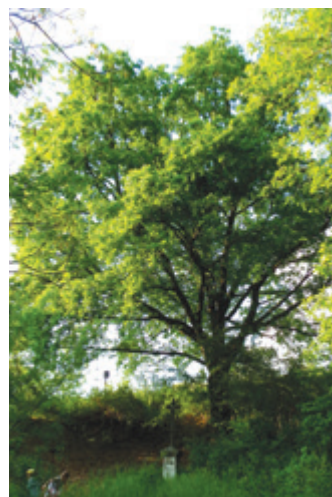
Dub letní poblíž ZŠ Meteorologická, kolem nějž chodí do školy již čtvrtá generace žáků. Více foto na FB MČ Praha-Libuš.

V ortofomapě z roku 1938 můžeme spatřit první náznaky