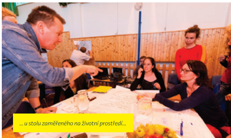
... u stolu zaměřeného na životní prostředí...