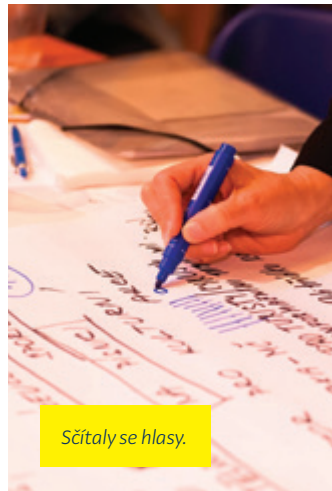
Sčítaly se hlasy.