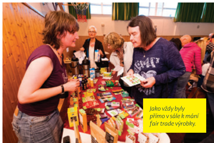
Jako vždy byly přímo v sále k mání fair trade výrobky.