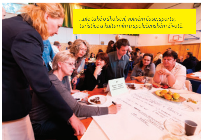
...ale také o školství, volném čase, sportu, turistice a kulturním a společenském životě.