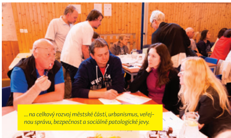
... na celkový rozvoj městské části, urbanismus, veřejnou správu, bezpečnost a sociálně patologické jevy.