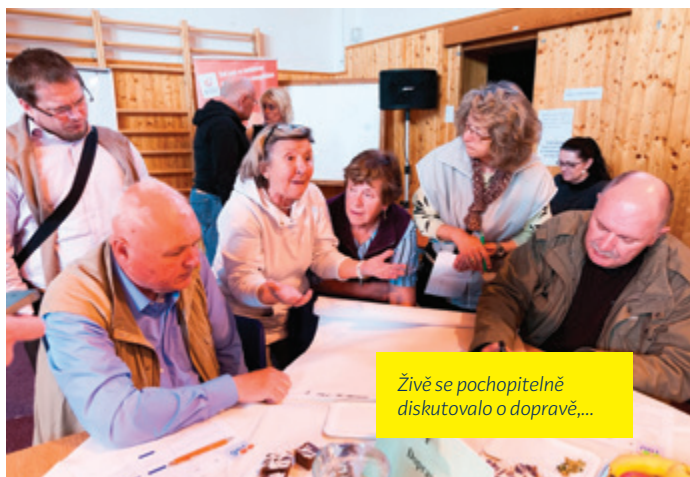
Živě se pochopitelně diskutovalo o dopravě,...