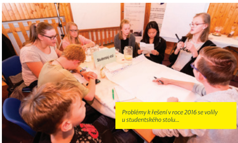
Problémy k řešení v roce 2016 se volily u studentského stolu...