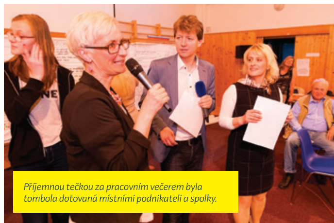
Příjemnou tečkou za pracovním večerem byla tombola dotovaná místními podnikateli a spolky.