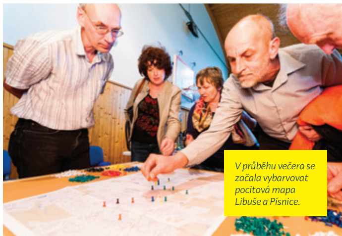
V průběhu večera se začala vybarvovat počítová mapa Libuše a Písnice.