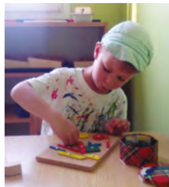
Montessori herna (4–7).

Montessori workshop na Modřanském veletrhu volnočasových aktivit.