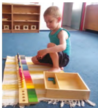
Montessori herna (1,5–4).