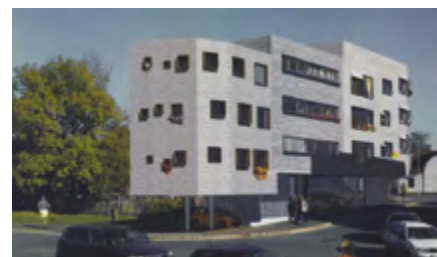
Navrhovaný bytový dům Výletní, jak jej prezentuje investor. Zdroj: Dokumentace předložená firmou Damila-Leasing pro stavební řízení.

3. Výjimka nesmí poškozovat nikoho z účastníků územního či stavebního řízení, zvláště ne majitele sousedního pozemku nebo sousední nemovitosti (vyhl. 501, § 23). Konkrétní znění: „Umístěním stavby nebo změnou stavby na hranici pozemků nebo v její blízkosti nesmí být znemožněna zástavba sousedního pozemku.“