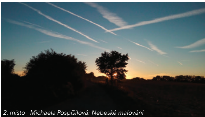
2. místo Michaela Pospíšilová: Nebeské malování