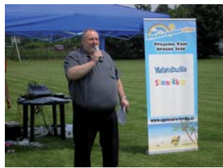
Dětský den v Písnici.