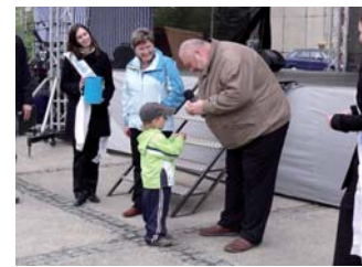
Libušsko-písnický jarmark 2010.