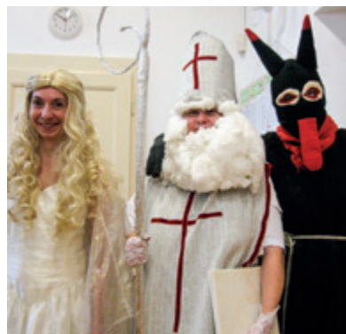
My se čerta nebojíme aneb s úsměvem jde všechno líp!