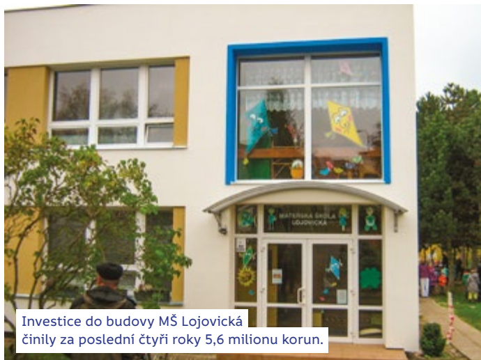
Investice do budovy MŠ Lojovická činily za poslední čtyři roky 5,6 milionu korun.