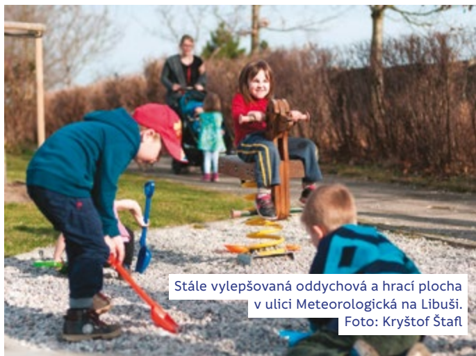
Stále vylepšovaná oddychová a hrací plocha v ulici Meteorologická na Libuši.