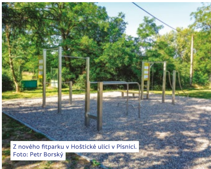
Z nového fitparku v Hořtické ulici v Písnici.