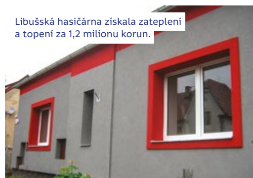
Libušská hasičárna získala zateplení a topení za 1,2 milionu korun.