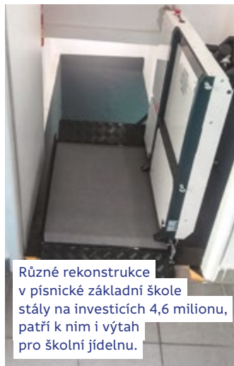
Různé rekonstrukce v písničské základní škole stály na investicích 4,6 milionu, patří k nim i výtah pro školní jídelnu.

kalí 4,5 mil. Hasiči si to zaslouží. Vážíme si jejich práce, na úkor svého volného času zajišťují bezpečnost nás všech, v tomto duchu vychovávají i mládež a významně se podílejí na společenském životě.