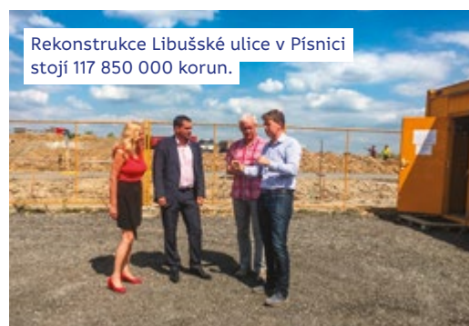
Rekonstrukce Libušské ulice v Písniči stojí 117 850 000 korun.

sičských zbrojnic, neváhali jsme a chopili se příležitosti. Štěstí nám přálo, protože současně vyhlásilo také ministerstvo vnitra dotace na zbrojnice. Nevím, jestli je možné představit si, co je za tím práce a času, když se řekne „získali jsme dotaci“, navíc takto vysokou dotaci. Bylo to složité, ale podařilo se. Také ze státního rozpočtu jsme zís-