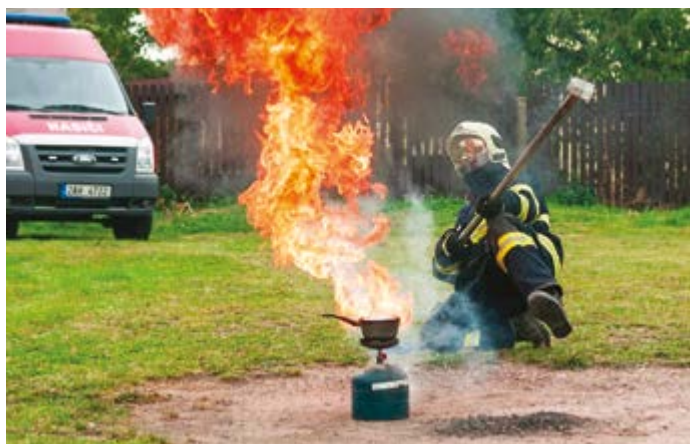
1. Hořící pánev nikdy nehaste vodou! Co se při takovém pokusu stane, vidíte na snímku – pára s olejem vytvoří hořící emulzi, která doslova vybuchne.

Písničtí hasiči na letošní Drakiádě a Dni zdraví názorně předvedli, co (ne)dělat, když se vznítí olej v kuchyni na pánvi.