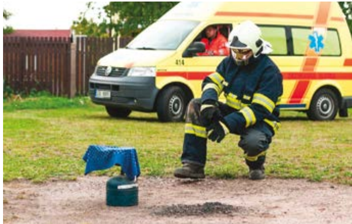
2. Správně je: vypnout sporák, namočit utěrku, vyždímat ji a pánev zakrýt. (kvá); Foto: Kryštof Štafl