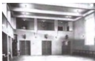
▲ Libušská sokolovna rok po výstavbě – 1930 ▼ Sokolovna v současnosti