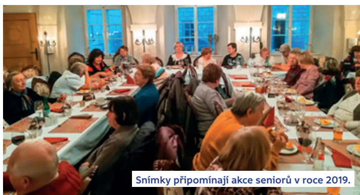
Snímky připomínají akce seniorů v roce 2019.