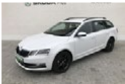
ŠKODA OCTAVIA COMBI 1,5 TSI / 110 KW STYLE PLUS EXTRA

Cena 489 000 Kč Do provozu 11/2019 Tachometr 15 788 km