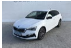
ŠKODA SCALA 1,6 TDI / 85 KW STYLE EXTRA

Cena 339 000 Kč Do provozu 3/2020 Tachometr 20 014 km