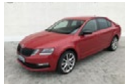
ŠKODA OCTAVIA 1,5 TSI / 110 KW STYLE PLUS EXTRA

Cena 489 000 Kč Do provozu 11/2019 Tachometr 12 959 km