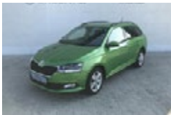
ŠKODA FABIA COMBI 1,0 TSI / 70 KW STYLE PLUS

Smotlachova 468/19, Praha 4 Šafaříkova 201/17, Praha 2