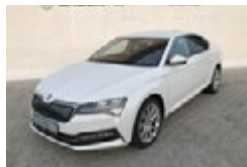
ŠKODA SUPERB IV 1,4 TSI / 115 KW STYLE PLUS

Cena 629 000 Kč Do provozu 10/2020 Tachometr 12 090 km