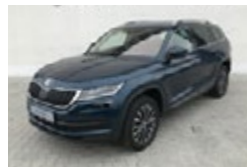
ŠKODA KODIAQ TDI 4x4 2,0 TDI / 140 KW STYLE PLUS

Cena 827 000 Kč Do provozu 7/2020 Tachometr 18 587 km