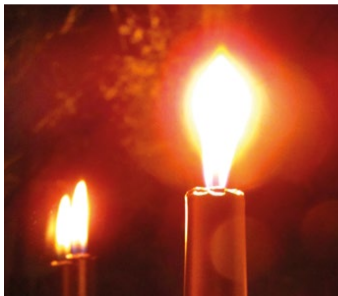
Památka zesnulých neboli „Dušičky“ připadá na 2. listopadu.

11. 11. nelze nepřipomenout svátek Martinů a ve velké části zemí světa se tento den slaví jako Den válečných veteránů, protože právě 11. 11. 1918 v 11 hod došlo k zakončení bojů 1. sv. války. 16. 11. mají svátek ti Otomarové, kteří jsou odvozeni od sv. Otomara ze Saint Gallen (*759). 17. 11. máme státní svátek Den boje za svobodu a demokracii, jenž je mezinárodně slaven od r.