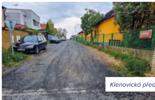
Klenovická před rekonstrukcí a nyní

Zuzana Kuryviálová, odbor životního prostředí a dopravy ÚMČ Praha-Libuš