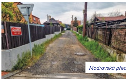
Modravská před rekonstrukcí a nyní