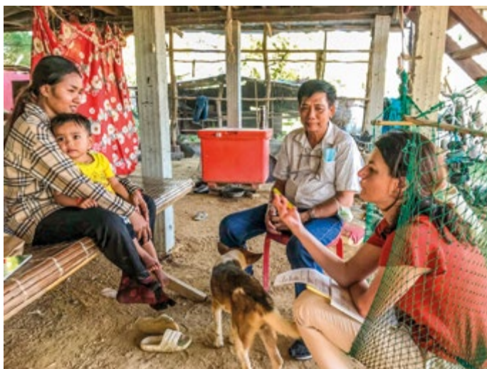
Hlubkový rozhovor s kméřskou matkou za pomoci tlumočnicka (Kambodža, 2023)

Připravili jsme programové prohlášení pro volební období 2022 až 2026. To vychází z volebních programů obou uskupení, která tvoří koalici. V minulých volebních obdobích se programové prohlášení nepřipravovalo, resp. nezveřejňovalo. Vnímáme to jako závazek vůči občanům. Když to vezmu průřezově, pracujeme na koncepčním přístupu k řešení problémových oblastí, v tuto chvíli hlavně doprava a energetiky, dále se chystáme na strategický plán, aby nebyl rozvoj obce nahodilý dle aktuálních nápadů, ale promyšlený v širším kontextu a prodiskutovaný se všemi klíčovými hráči, opozicí a občany především. Jen tak lze zajistit kontinuitu. Připravujeme zkulturnění a otevření prostoru mezi obecními budovami čp. 35 a čp. 1 (budova s poštou) veřejnosti, a vytvoření tak centra obce, které zde chybí, prioritou je mít dostatek míst v MŠ a ZŠ a celkově posílit kvalitu vzdělávání na naší městské části, už zmíněný park Na Jezerách,